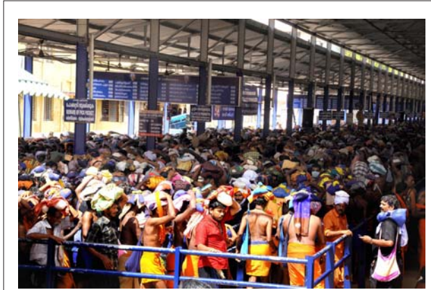
ശബരിമല സന്നിധാനത്തെ വലിയനടപ്പന്തലിൽ ഇന്ന് (ഡിസം-4) വൈകുന്നേരം അനുഭവപ്പെട്ട ഭക്തജനത്തിരക്ക്.

രാവിലെ ശബരിശ ദർശനത്തിനെത്തിയ ഭക്തരുടെ നിര ശരംകുത്തി കഴിഞ്ഞും നീണ്ടു. മണിക്കൂറുകൾ ഭക്തർ അയ്യപ്പദർശനത്തിന് കാത്തുനിന്നു. ഉച്ചയ്ക്ക് ശേഷവും തിരക്ക് ക്രമാതീതമായി വർദ്ധിക്കുകയാണ്. ഉച്ചയ്ക്ക് നടപ്പന്തൽ കഴിഞ്ഞും ഭക്തരുടെ നിര നീണ്ടു. അപ്പം അരവണ കൗണ്ടറുകൾക്ക് മുന്നിലും വൻതിരക്കാണ് അനുഭവപ്പെടുന്നത്. കൂടാതെ നെയ്യദിഷേകത്തിന് പരിശോധന ഏർപ്പെടുത്തിയതും തിരക്ക് വർദ്ധിപ്പിച്ചു. പോലീസും കേന്ദ്രസേന വിഭാഗങ്ങളും കനത്ത പരിശോധനയ്ക്ക് ശേഷമാണ് ഭക്തരെ കടത്തിവിടുന്നത്.